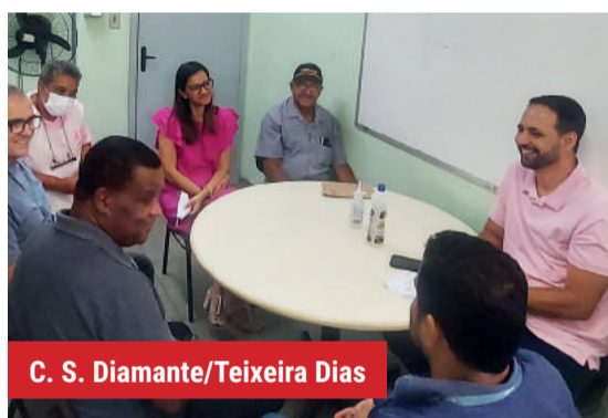
C. S. Diamante/Teixeira Dias

Com apenas seis consultórios, a unidade atende 15 mil usuários. A equipe faz rodízio nas salas de atendimento e lida com constantes infiltrações. “A situação é crítica. Não há espaço para ampliação. Faço coro à demanda dos usuários pela construção de uma nova sede em outro local”, comprometeu-se Wanderley.