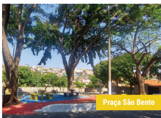
Praça São Bento