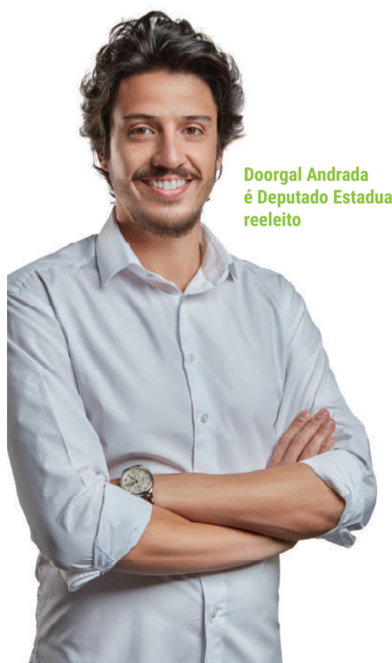
Doorgal Andrada é Deputado Estadual reeleito