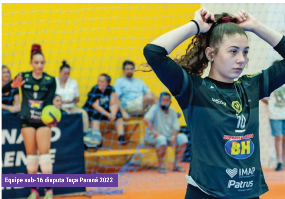
Equipe sub-16 disputa Taça Paraná 2022