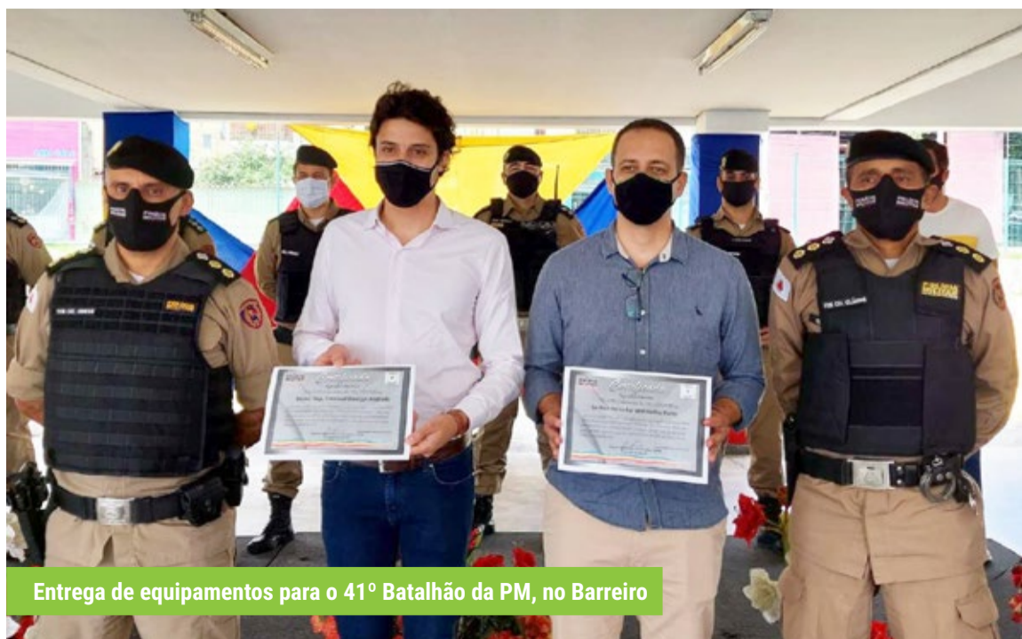
Entrega de equipamentos para o 41º Batalhão da PM, no Barreiro

Doorgal fez um balanço positivo de seu primeiro mandato de deputado estadual, particularmente pela atuação na área de saúde e pela defesa de mais autonomia para os municípios mineiros. Destacou também ações em favor da segurança, com a destinação de equipamentos e veículos para o setor.