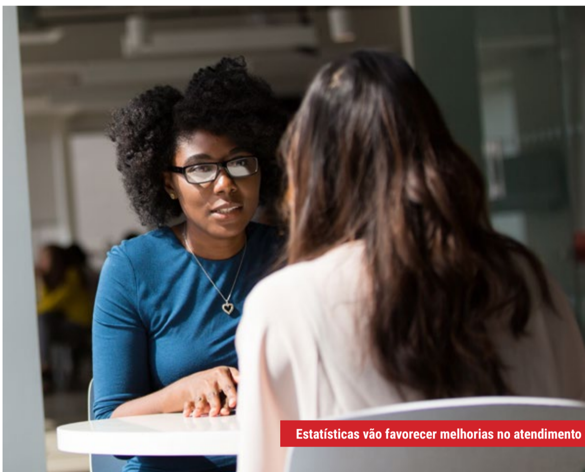
Estatísticas vão favorecer melhorias no atendimento

Finalmente Belo Horizonte poderá ter um Dossiê das Mulheres. O Plenário da Câmara Municipal aprovou, de forma definitiva, o projeto de lei que vai permitir a elaboração de estatísticas periódicas sobre as mulheres atendidas por políticas públicas do Município. Por meio do dossiê, serão organizados e analisados todos os dados em que se identifique violência contra a mulher, tanto no âmbito público quanto no privado.