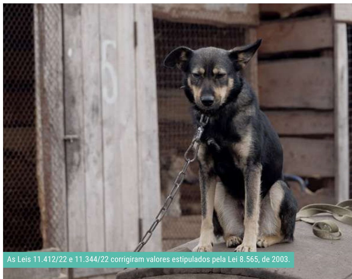
As Leis 11.412/22 e 11.344/22 corrigiram valores estipulados pela Lei 8.565, de 2003.