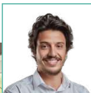
Deputado Estadual Doorgal Andrada