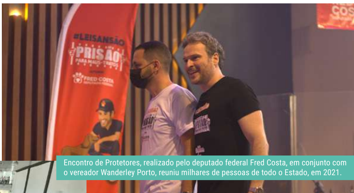
Encontro de Protetores, realizado pelo deputado federal Fred Costa, em conjunto com o vereador Wanderley Porto, reuniu milhares de pessoas de todo o Estado, em 2021.

Belo Horizonte tem o Dia Municipal do Protetor de Animais . Comemorada no dia 10 de agosto, a data homenageia pessoas e entidades cuja atuação é decisiva para a proteção dos animais na cidade. A lei 11.432, foi criada em 2022 pelo vereador Wanderley Porto, defensor da causa animal. Trata-se de um reconhecimento ao empenho cotidiano e heroico de voluntários que protegem e acolhem animais abandonados e vítimas de maus-tratos.