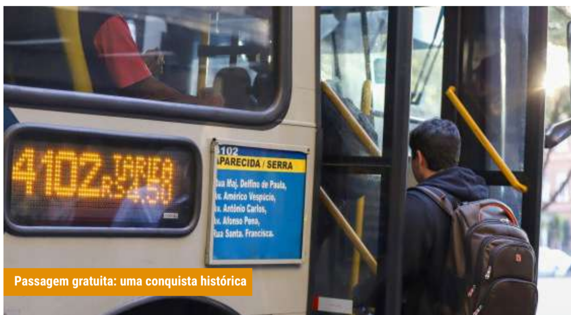
Passagem gratuita: uma conquista histórica

Desde 08 de agosto, estudantes do Ensino Médio e da Educação de Jovens e Adultos (EJA) têm transporte gratuito em BH. O Passe Estudantil é destinado a quem mora a, no mínimo, 1 km da escola. Beneficiários de programas sociais têm prioridade. Estudantes de escola particular que têm bolsa integral e programas sociais também fazem jus à gratuidade.