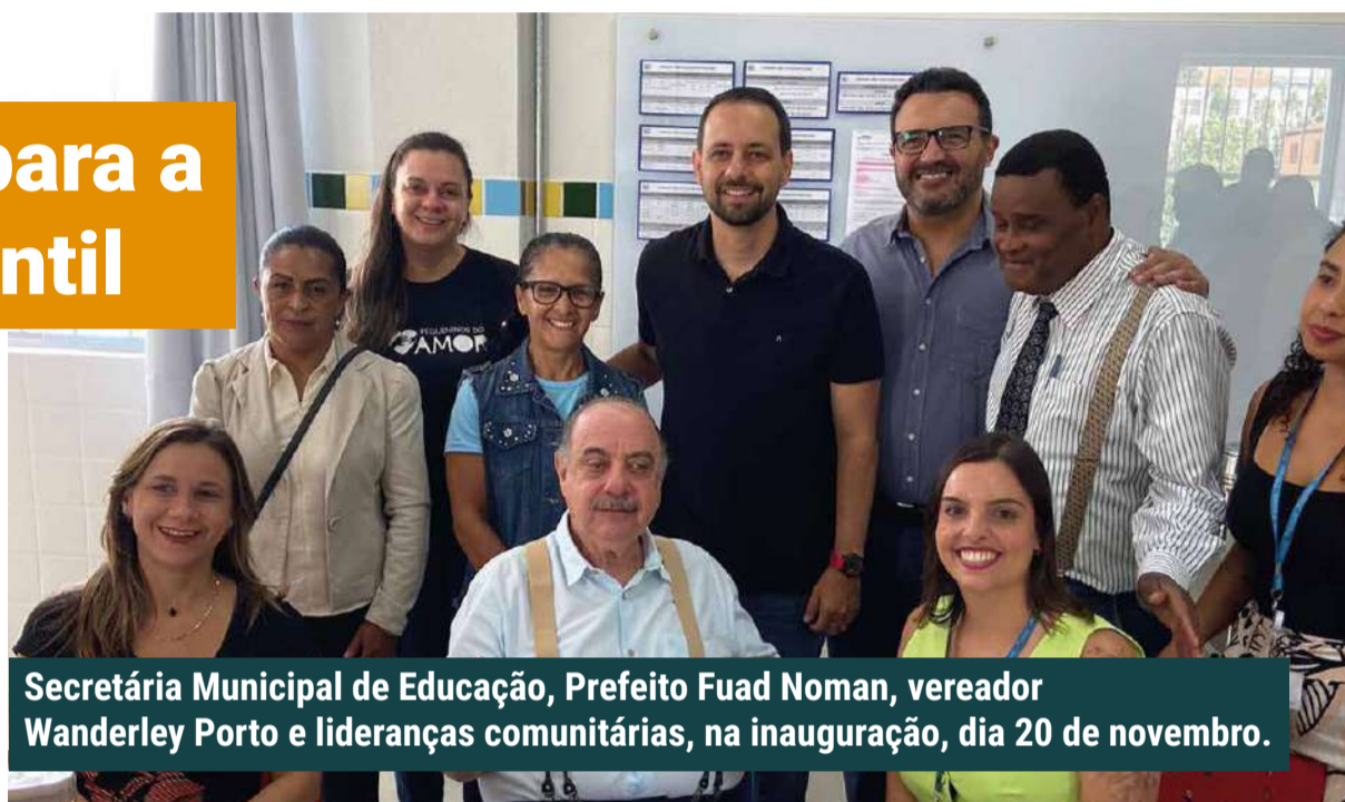
Secretária Municipal de Educação, Prefeito Fuad Noman, vereador Wanderley Porto e lideranças comunitárias, na inauguração, dia 20 de novembro.

A Escola Municipal de Ensino Infantil (EMEI) Pilar/Olhos D'Água acaba de ganhar 270 vagas para crianças de 0 a 3 anos. Foram investidos R$ 3 milhões na obra de reforma e ampliação.