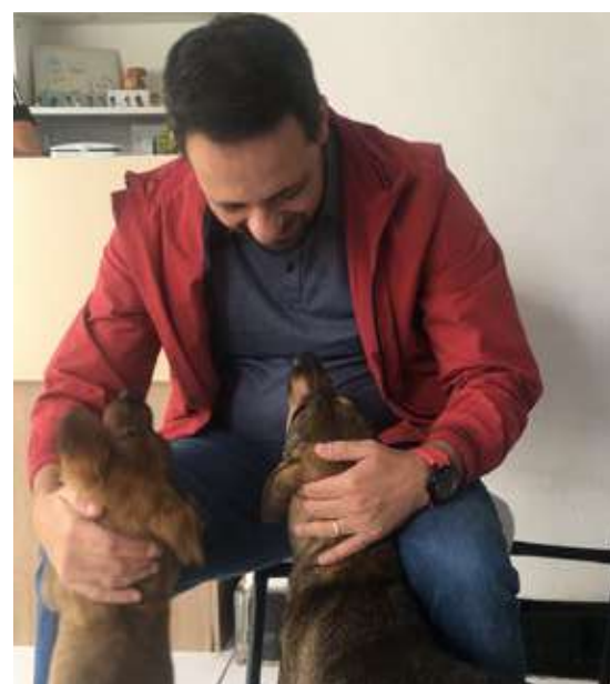
Realização de eventos de adoção e manutenção de abrigos → R$ 100 mil