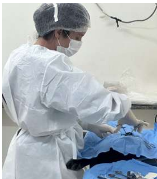
Compra de equipamentos e materiais para o Centro de Apoio e Diretoria da Zoonoses → R$ 300 mil