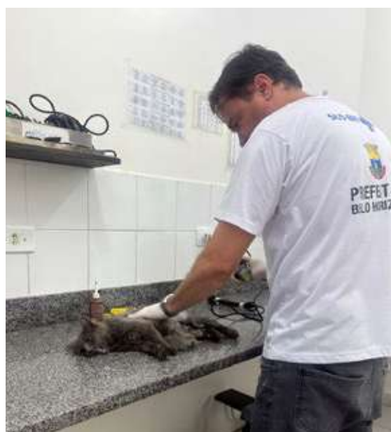
Compra de materiais para os Centros de Esterilização de Cães e Gatos → R$ 200 mil