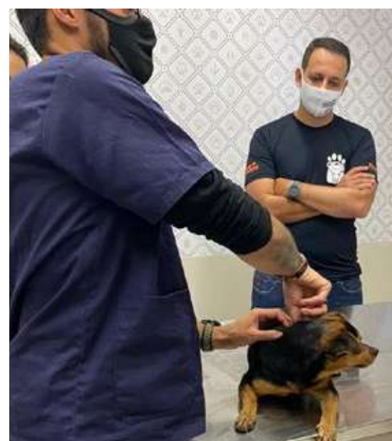
Hospital Público Veterinário → R$ 169 mil