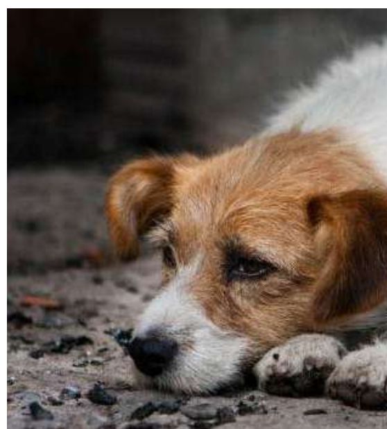
Atendimento a animais resgatados em vias públicas → R$ 300 mil