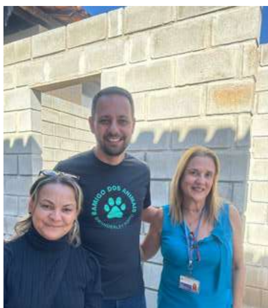
Reforma, ampliação e compra de equipamentos e materiais cirúrgicos para o CCZ → R$ 300 mil