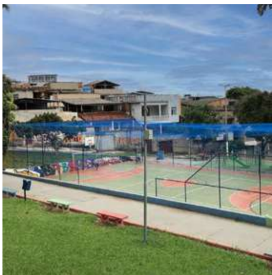
PRAÇA DA ECOLOGIA, VALE DO JATOBÁ

Emenda: R$ 118 mil. Depois de revitalizada, recebeu brinquedos e agora a quadra ganhou cobertura.