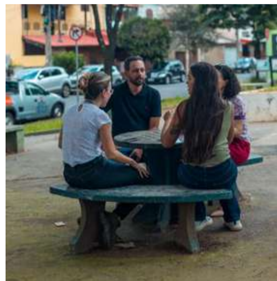
PRAÇA JOÃO BAID, TIROL

Emenda: R$ 200 mil. Revitalização e implantação de playground.