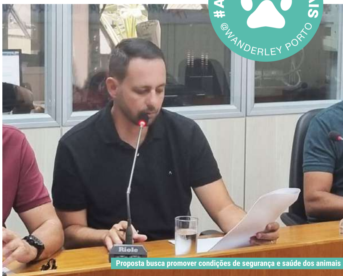
Proposta busca promover condições de segurança e saúde dos animais

Enquanto não ocorre a extinção total das carroças em BH, em janeiro de 2026, essas normas poderão promover o bem-estar dos equídeos e práticas mais éticas de manejo.