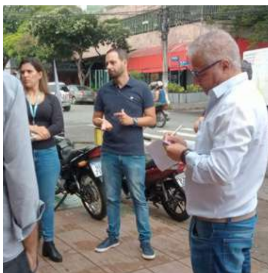
AV SINFRÔNIO BROCHADO

Vistoria com a prefeitura para solicitar implantação de quebra-molas