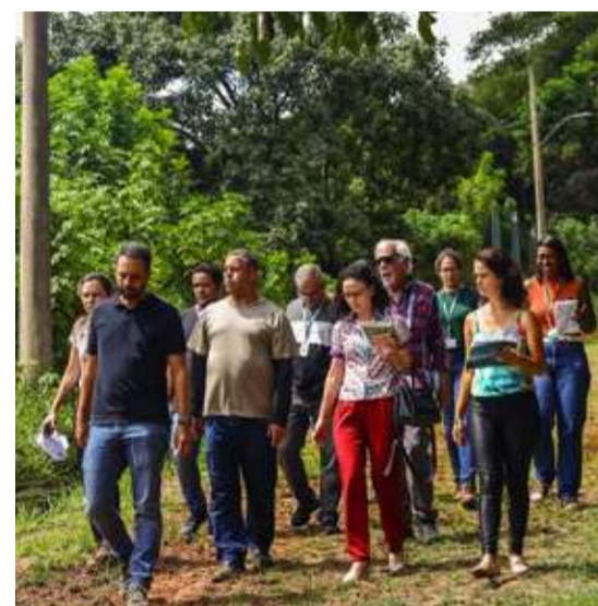
TRILHA NO PARQUE DAS ÁGUAS

Entulho e lixo deram lugar a uma área de convivência na Rua Padre Henrique Vaz