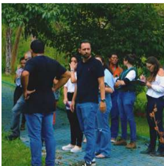
BARREIRO VAI GANHAR SEU PRIMEIRO PARCÃO

Emenda: R$ 200 mil. Revitalização e implantação de playground (ao lado da Escola Municipal Helena Antipoff)