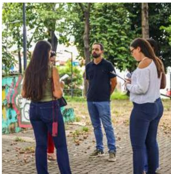
PRAÇA JOSÉ RAIMUNDO, ROTATÓRIA DO TIROL

Emenda: R$ 118 mil. Depois de revitalizada, recebeu brinquedos e agora a quadra ganhou cobertura.