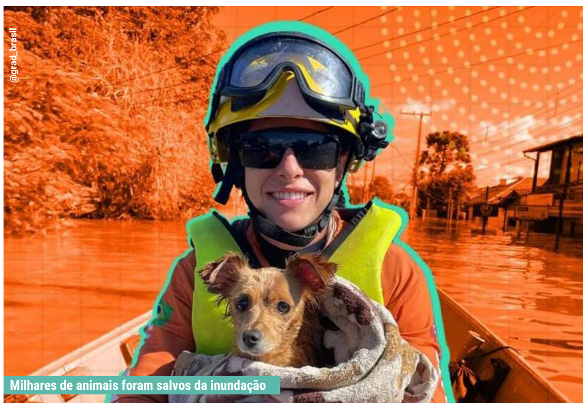
Milhares de animais foram salvos da inundação

A maior tragédia do país, decorrente das enchentes no Rio Grande do Sul, também vitimou inúmeros animais. A atuação do GRAD Brasil - Grupo de Resposta a Animais em Desastres, tem sido decisiva para salvar muitas vidas de animais de todos os portes. Cachorros, gatos, cavalos, coelhos, galinhas, porcos, diversas espécies animais, foram resgatadas.