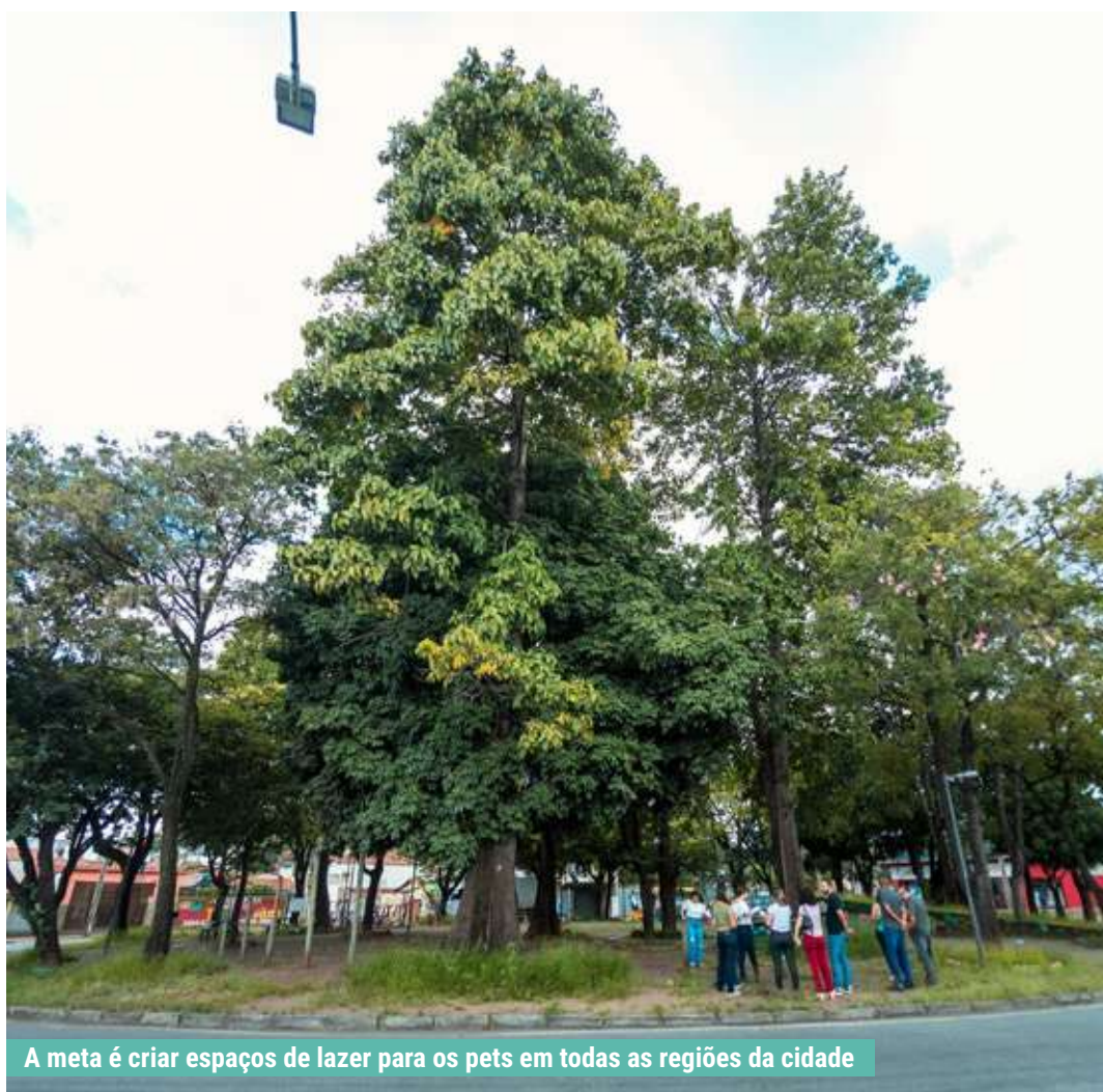
A meta é criar espaços de lazer para os pets em todas as regiões da cidade